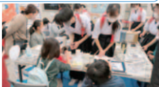
書道部も参加!科学は理科だけではなく。