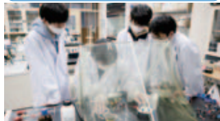
Mg 二次電池の研究中!