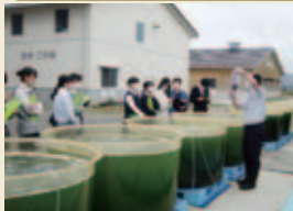
相馬で、栽培漁業について学びました。