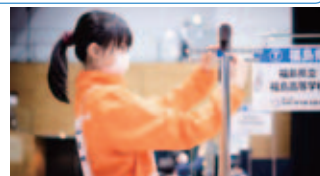
競技風景です。