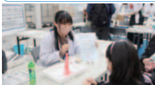
福高 SS 部主催。 子どもたちに科学のおもしろさを伝えたい!