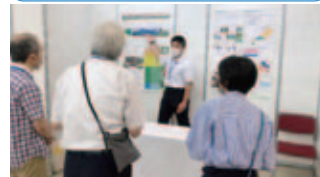
要点をわかりやすくまとめたポスターで堂々と発表。