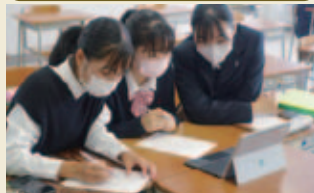
自分たちでアポをとり、専門家にオンラインでアドバイスをもらいます。