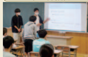
2年次生の研究に的確な助言。成長を自他ともに感じられる時間です。