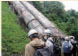
猪苗代第一発電所をじっくり見学。