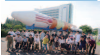
JAXA 筑波宇宙センターを見学!