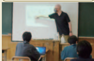
全編英語での講義を受講します!