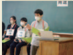
「論理的に考察する力」をディベートで養います。