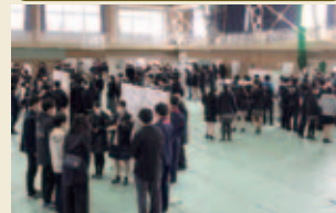
研究の成果をポスター発表。質問にも答えます。