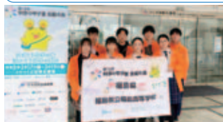
福島県代表として出場してきました!