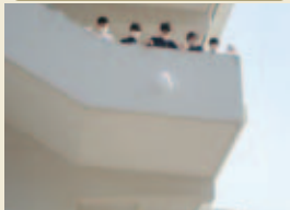
1枚の画用紙で、3階から落ちる卵を守れ!