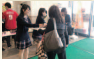
広島で福島県産桃ジュースの試飲会!