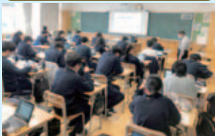
話題のプログラミング言語を学びます。