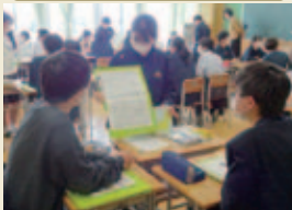
1年次から、まとめて発表する力を養います。