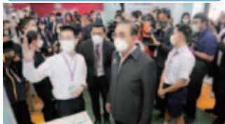
タイの高校と姉妹校になっています。